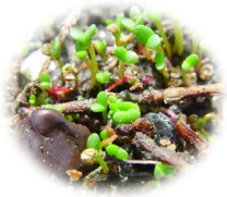
芽吹いたアックシソウ

当観察館前にある花壇では、今年もアックシソウを栽培中！！ 今年は例年と代わり、8区画にしきりを付け、それぞれ違った条件をもって栽培しています。 ただいま、芽吹いた状態ですが、、、さて、どのように成長しているかみなさんの目で確かめてください。