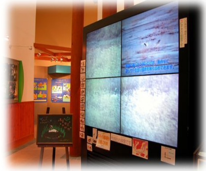
当観察館自慢の大型テレビ

当観察館には2階に展望室、1階に大型テレビがあり、展望室からはフィールドスコープを使って湿原全体をそして、大型テレビからは水鳥たちを66倍のレンズを使ったカメラからナント生中継でみることが出来ます！