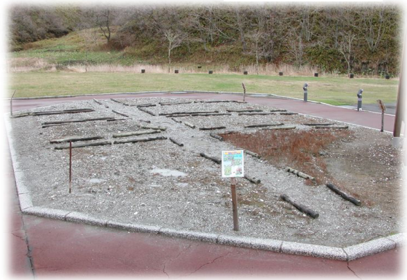
観察館前のアックシソウ花壇