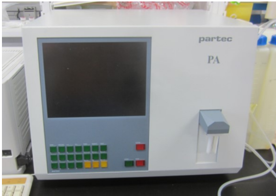
第1図 フローサイトメーター