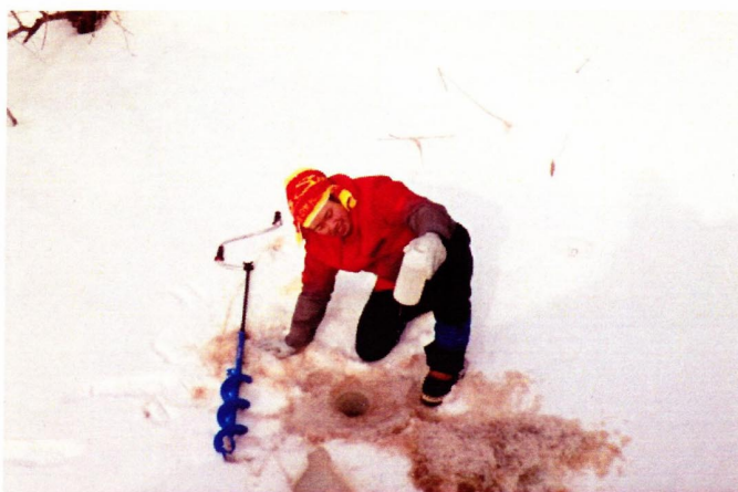
図2 別寒辺牛川上流部での採水調査の様子(2月)。河川結氷のため、ドリルで穴を開け採水する。

態学研究室に持ち帰った後、DNA抽出キット(DNeasy, Qiagen社)でDNA抽出を行い、魚類用ユニバーサルプライマーである MiFish プライマー(Miya et al. 2015)を用いてDNA解析領域のPCR増幅を行った。DNA抽出・PCR増幅に関してはすべてのサンプルで完了しており、現在これらのサンプルのDNA塩基配列から種判別を行うため、次世代シーケンサーを用いた解析を実施中である。