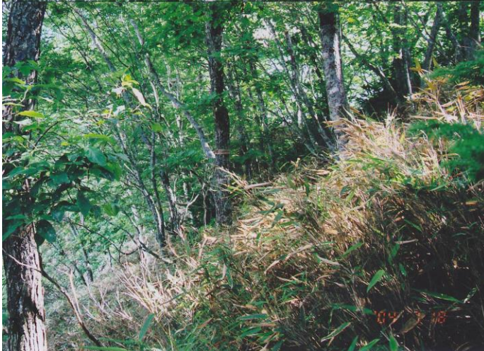
写真2. アオサギ非営巣地