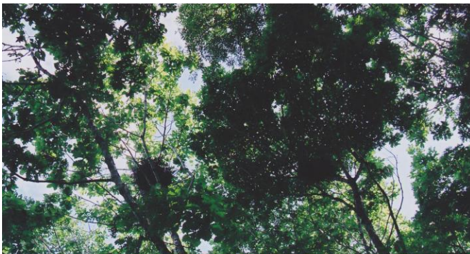
写真1. アオサギ営巣地