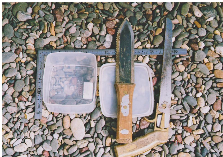
写真 3. 土壌採取容器と用具

調査方法：本調査はすべて定量調査とした。定量調査のため縦×横×深さ=10×10×5 cm のプラスチック容器（写真 3）を使用した。これを土壌面に打ち込み土壌サンプルを採取した。1 回の定量調査で、8 個（アオサギ営巣地が 4 個、アオサギ非営巣地 4 個）の土壌サンプルを採取し、それを別々にツルグレン装置に掛け土壌動物を抽出した。なお、ツルグレン装置に掛け前と後で土壌サンプルの重量を測った。前者を湿重量 (Wg)、後者を乾重量 (Dg) とし、それらから (W-D) / W \times 100 式で含水率を求めた（表 1）。土壌サンプルが完全に乾燥するまでツルグレン装置に掛け、その抽出時間は 3 日間を要した。